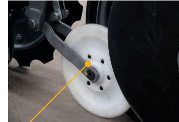
RUEDA APISONADORA DE SEMILLAS