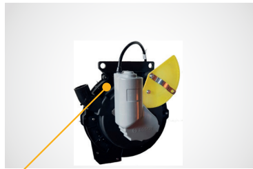
CORTE SURCO X SURCO CON MOTOR ELÉCTRICO BOSCH