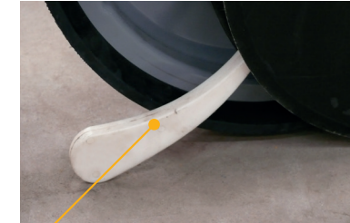
LENGÜETA APISONADORA DE SEMILLAS

Chasis De 1 a 3 módulos con distancias de siembra de 420, 525 y 700 mm.