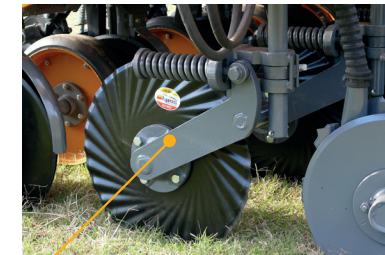
KIT LABRANZA CERO

Dimensiones Ancho de transporte en el camión 3,5 m Ancho de transporte con el tractor 3,6 m Despeje en el traslado 620 mm.