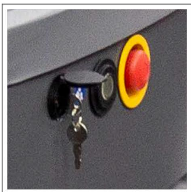
Parada de emergencia Indicador de estado Llave de apertura