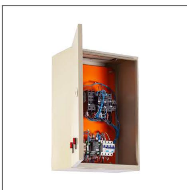
Tablero automático incluido