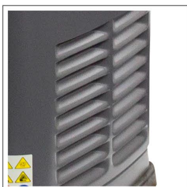
Salida de ventilación