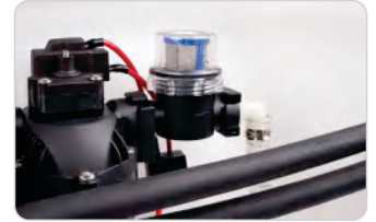
Filtro externo desmontable