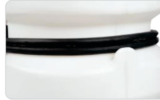
Manguera de alta presión