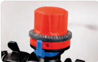
Válvula reguladora de presión (opcional)