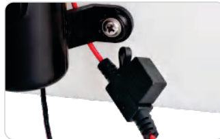
Bomba con fusible especial