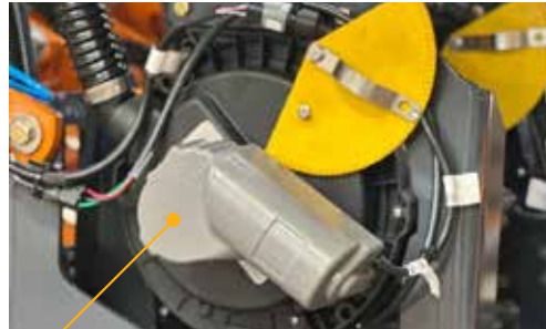
DOSIFICADOR NEUMÁTICO CON MOTOR ELÉCTRICO