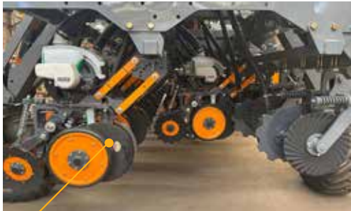
APTA PARA CUALQUIER TIPO DE DOSIFICADOR NEUMÁTICO E INSTALADO EN LA CONFIGURACIÓN DESEADA