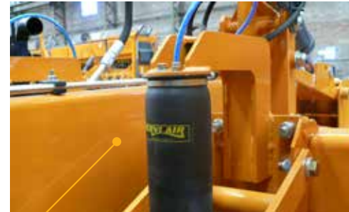
CONTROLADOR DE PRESIÓN NEUMÁTICO O HIDRÁULICO