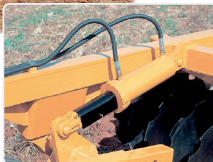
Traba del cilindro para transporte.

La Rastra Aradora TATU Control Remoto - ATCR, proporciona un elevado rendimiento en la preparación del suelo para la siembra de cereales, o en desterronamiento, después del uso de rastras pesadas. El eficiente sistema de rodaje permite maniobras rápidas y transporte seguro, ayudando en el control de la profundidad. La estructura mantiene la estabilidad ideal con penetración uniforme en cualquier tipo de suelo.